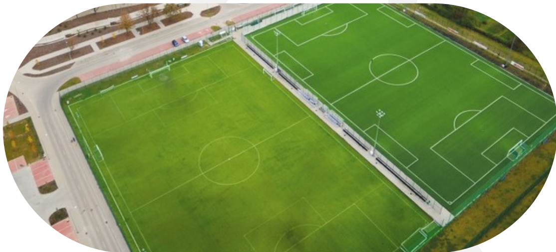
boiska pełnowymiarowe z nawierzchnią sztuczną i naturalną